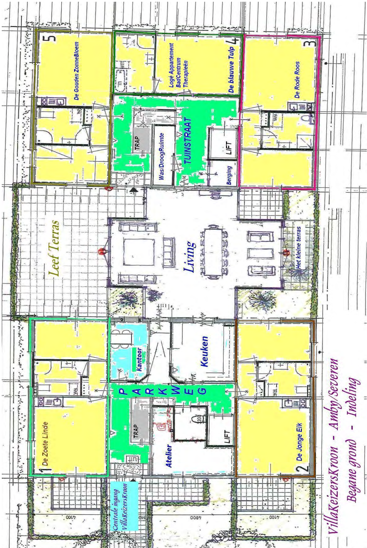
Villa Keizerskroon - Amby/Severen Begane grond - Indeling

Dit is de indeling van Project 1 – Park.