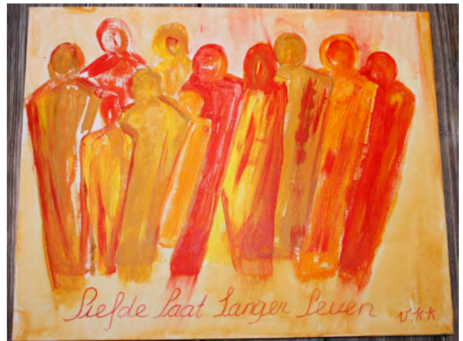
Door alle bewoners geschilderd, onafhankelijk van zorgzwaarte.