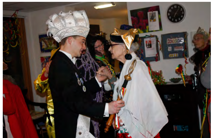
De Prins op bezoek .....