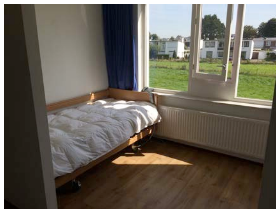
Slaapkamer met uitzicht op weiland

Woonkamer met kitchenette, gang, badkamer en muurkast