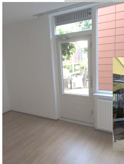
Slaapkamer met uitgang naar eigen terras